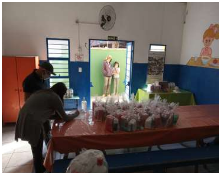
ENTREGA DE MARMITEX – SESI SOROCABA