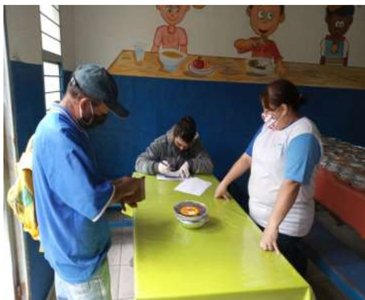
VELE COMPRAS – INSTITUTO COOPERFORTE/ FUNDAÇÃO BANCO DO BRASIL